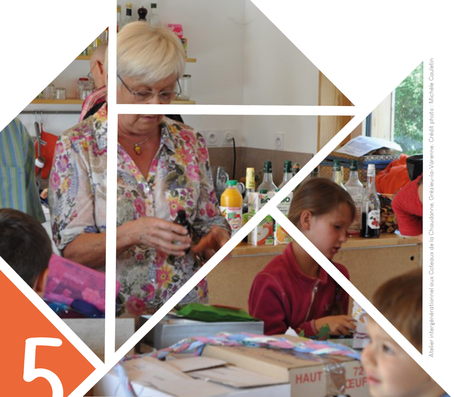
Atelier intergénérationnel aux Coteaux de la Chaudanne, Grézieu-la-Varenne.