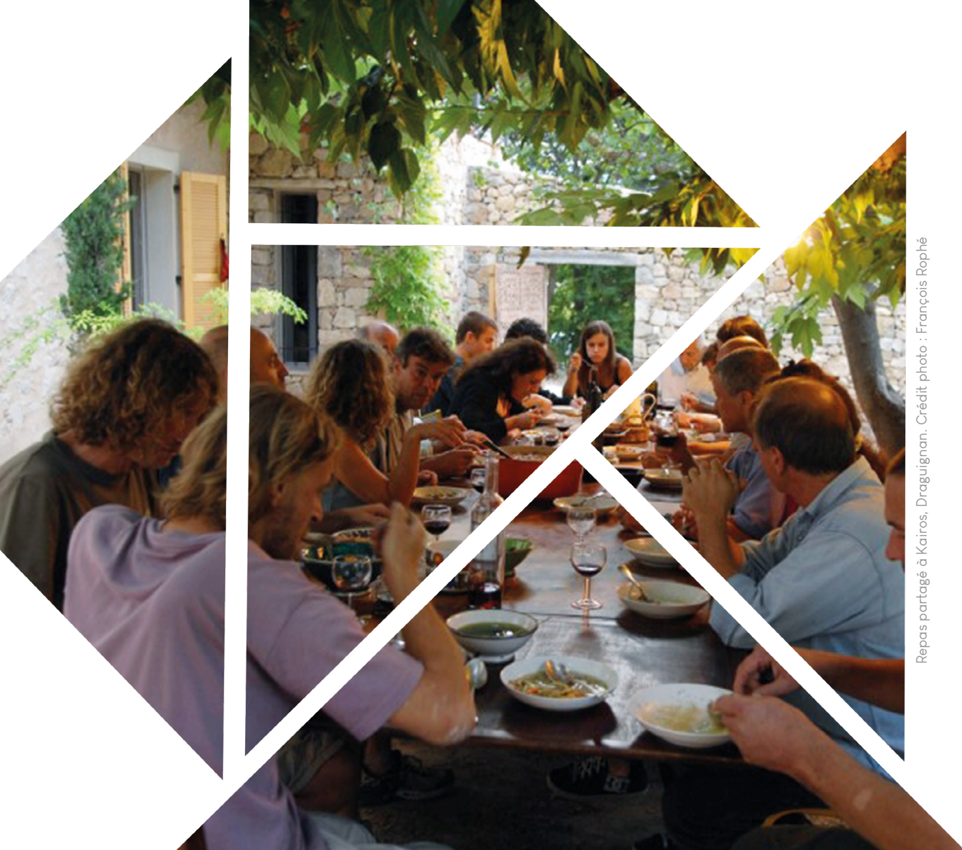
Repas partagé à Kairos, Draguignan.