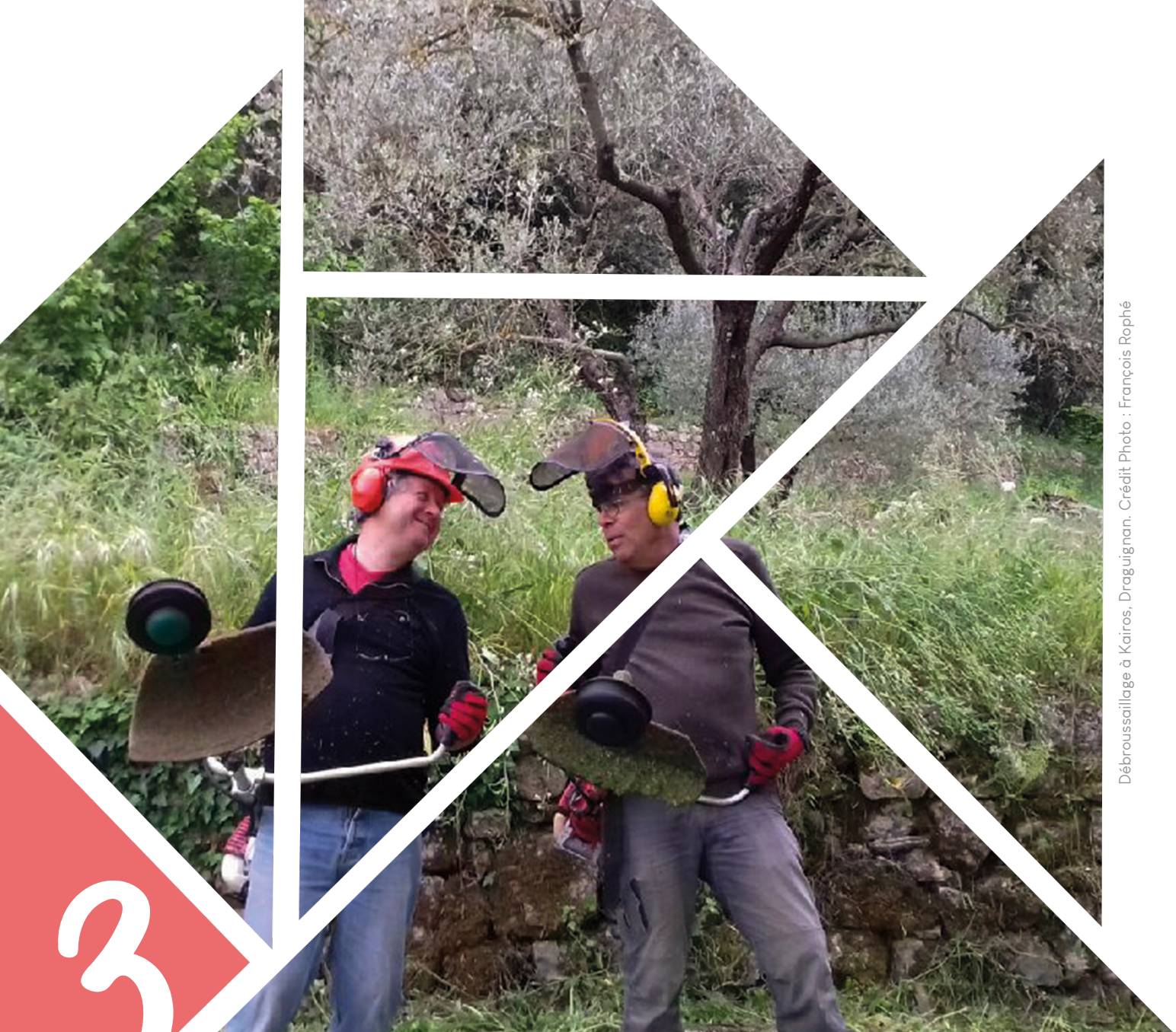
Débroussaillage à Kairos, Draguignan.