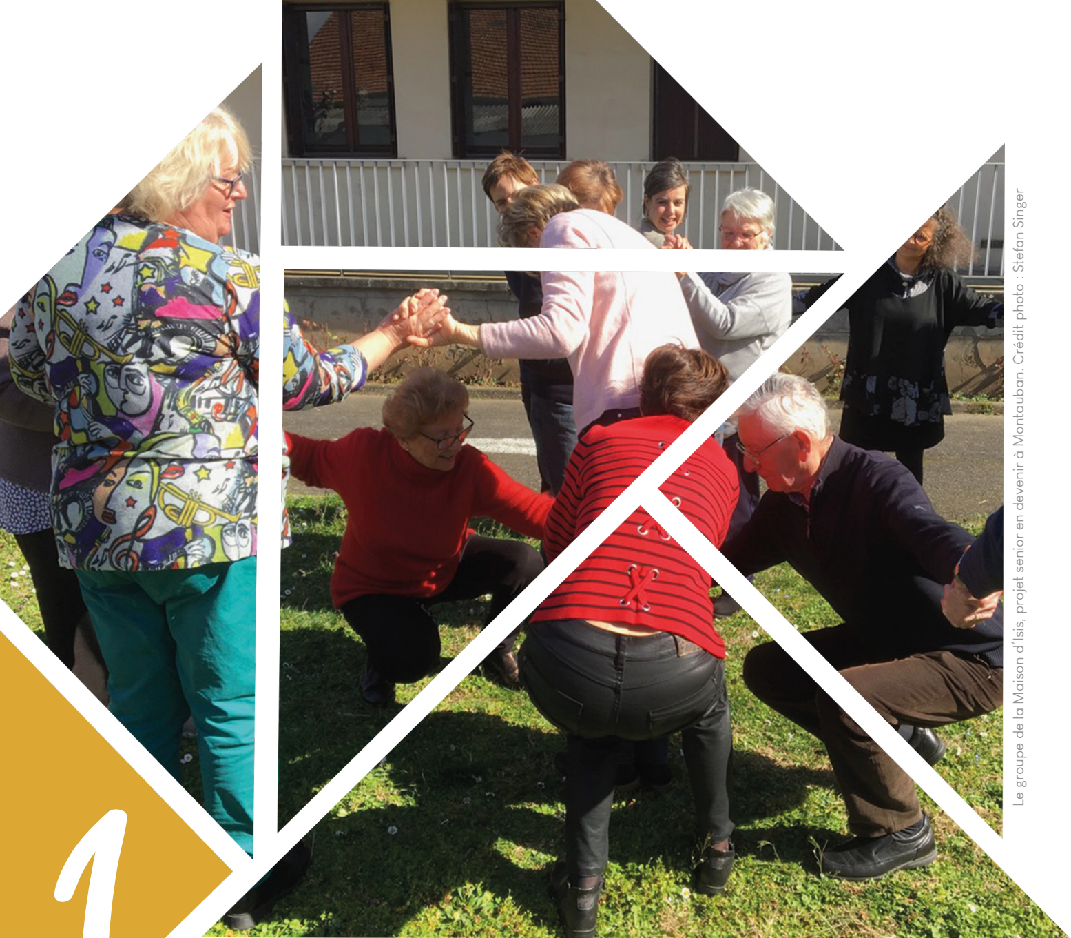
Le groupe de la Maison d'Isis, projet senior en devenir à Montauban.