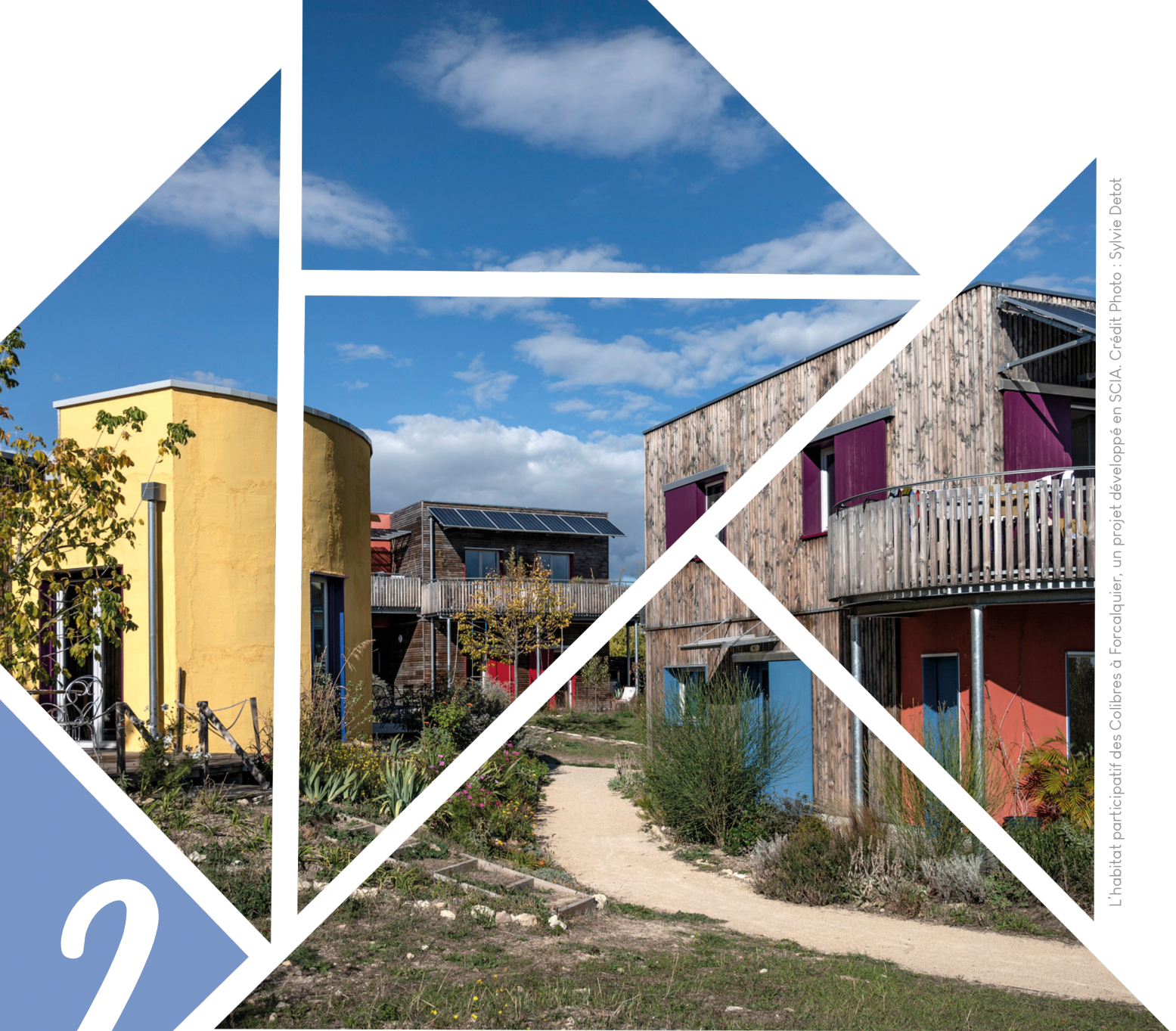
L'habitat participatif des Colibres à Forcalquier, un projet développé en SCIA.